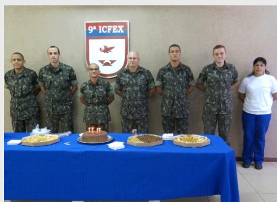
Aniversariantes de Março e Abril de 2013