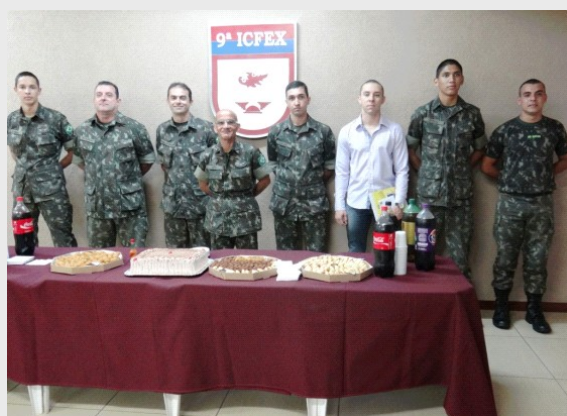
Aniversariantes de Janeiro e Fevereiro de 2013

A Inspeção comemorou, com duas cerimônias, realizadas nos meses de fevereiro e abril do corrente ano, a data natalícia dos seus Integrantes, que aniversariaram no 1º Quadrimestre de 2013.