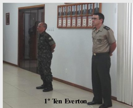
1º Ten Everton