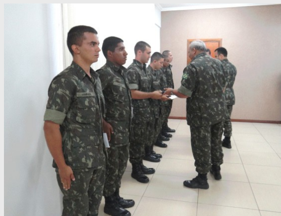
SD/EV DOURADO, SD/EV LUCAS, SD/EV MÔNACO, SD/EV ROCHA, SD/EV ROMANO, SD/EV FERNANDO

Aos novos integrantes da Inspeção as nossas boas-vindas!