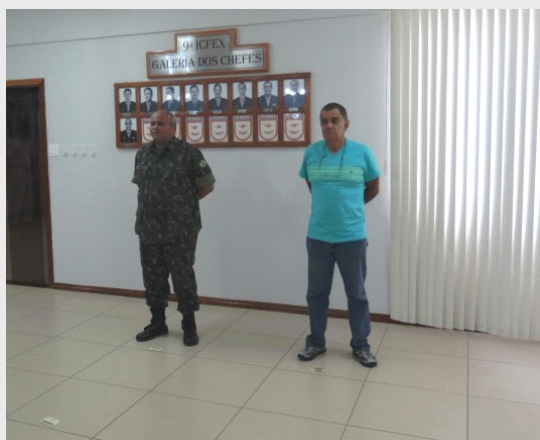
2º TEN PTTC VERAS

A 9ª ICFEx realizou, no segundo quadrimestre, formaturas de recepção aos novos integrantes.