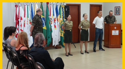
DESPEDIDA DE MILITARES 4