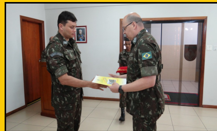
DESPEDIDA DE OFICIAL 3