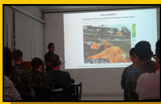
MOMENTO MEIO AMBIENTE 5