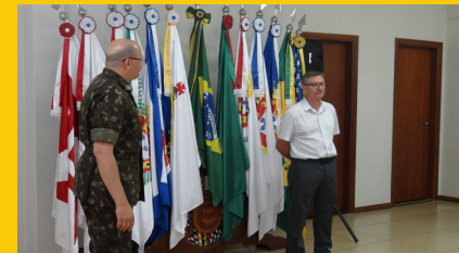
APRESENTAÇÃO DE OF PTTC 5