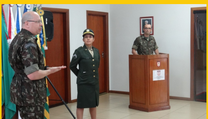
APRESENTAÇÃO DE PRAÇA 3