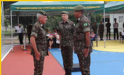
PASSAGEM DE CHEFIA 2