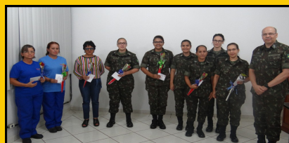
DIA INTERNAC DA MULHER 6