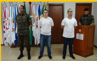
LICENCIAMENTO DE SD EV 2